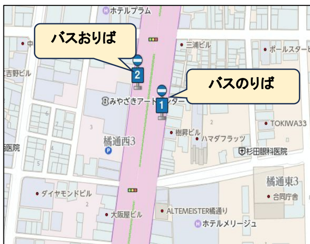
橘通三丁目バス停