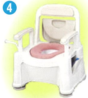
品名: ポータブルトイレ座楽背もたれ型 SP小口径便座タイプ 品番: SPTSPMB