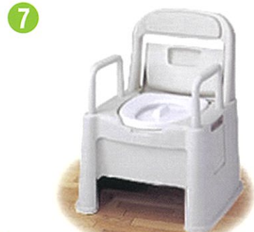
品名: ポータブルトイレ座楽 背もたれ型HD 品番: SPTH