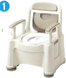
品名: ポータブルトイレ座楽 背もたれ型 SP 品番: SPTSP