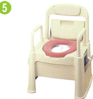
品名: ポータブルトイレ座楽 背もたれ型 品番: SPTSD