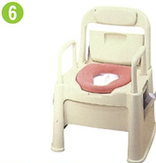
品名: ポータブルトイレ座楽 背もたれ型SB 品番: SPTSB