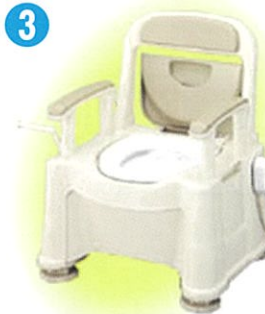
品名: ポータブルトイレ座楽 SP あたたか 品番: APTSP