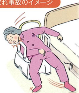
はさまれ事故のイメージ

ご使用中のお客様には大変ご迷惑をおかけいたしますことを深くお詫び申し上げます。何卒ご理解とご協力をお願い申し上げます。