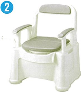
品名: ポータブルトイレ座楽背もたれ型 SPソフト便座・便フタタイプ 品番: SPTSPS