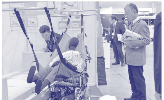
※写真は昨年の会場の様子です。